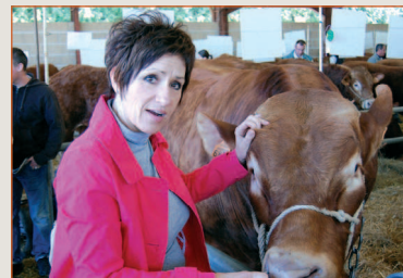
Festival limousin à Chabonais