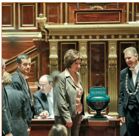
Vote dans l'Hémicycle