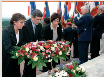
Cérémonie au Mémorial de Chasseneuil sur Bonnieure