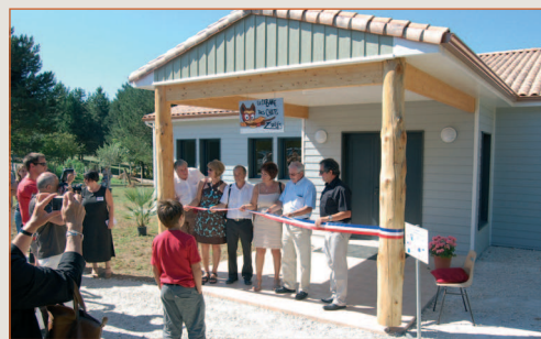
Inauguration micro crèche de Chazelles