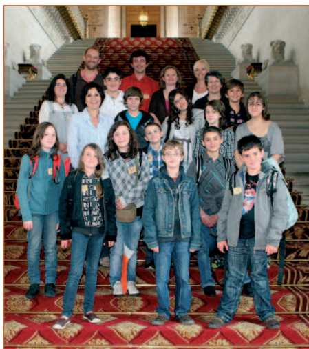
Conseil Municipal des Jeunes de Chasseneuil-sur-Bonnieure en visite au Sénat