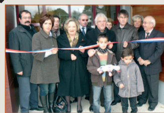
Inauguration crèche intercommunale à Jarnac