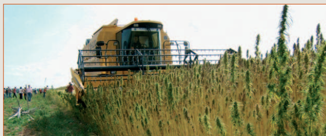
Récolte du chanvre sur le canton d'Aigre

Après des années de recherche, de mobilisation des acteurs (agricoles, scientifiques, industriels et politiques), je m'engage pour que cette filière «novatrice» voit le jour prochainement dans notre département.