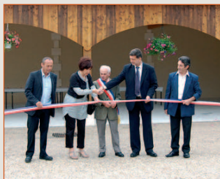
Inauguration préau de Curac