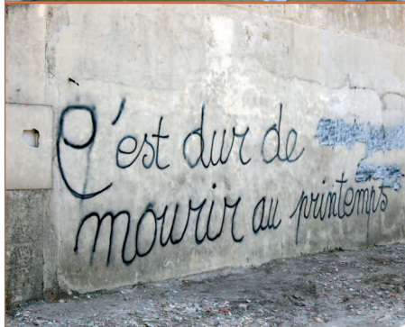
Déplacement en Charente Maritime et Vendée de la mission Xynthia

A u cours de la session parlementaire (2009 – 2010), j'ai été présente au Sénat, au moins deux jours par semaine, en séance publique et/ou dans ma commission (commission des lois) ou bien dans les groupes de travail dont je suis membre.