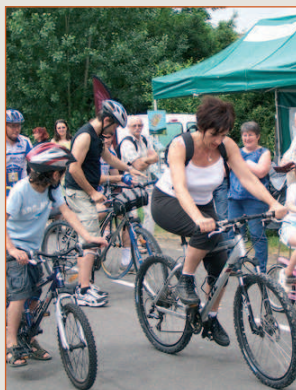
Inauguration boucle cycliste

La carte précise les communes (en orangé) où j'ai rencontré les élus et/ou j'ai pu soutenir des projets.