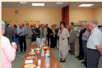
«Drôles et drolesses» Saint Angeau