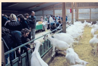
Inauguration de «La Ruche qui dit Oui !» à Juillé