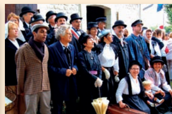
Les 100 ans du Petit Mairat - St Ciers s/ Bonnieure