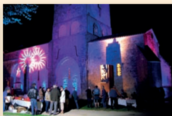
Festival Nuit Romane à Mouton