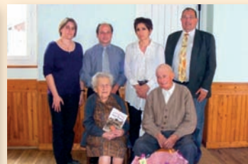
Repas des Aînés à Saint Front