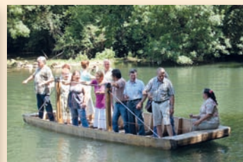
Inauguration de la barque à Lichères