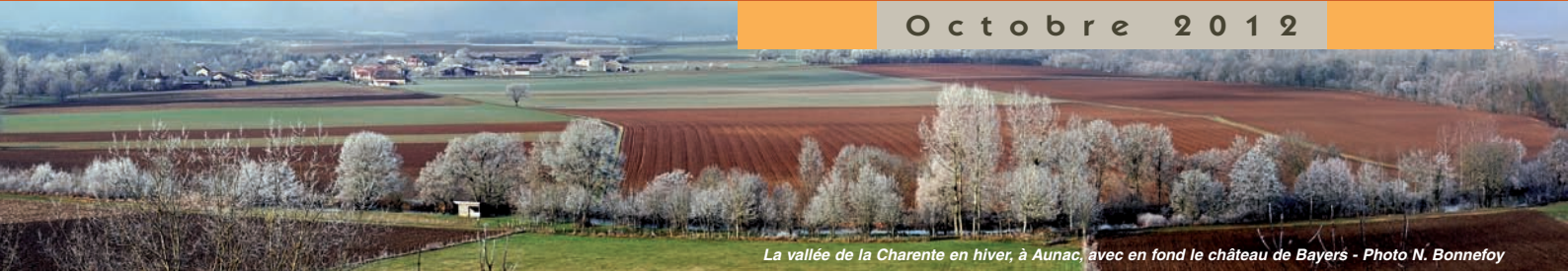
La vallée de la Charente en hiver, à Aunac, avec en fond le château de Bayers