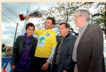
Criterium de Terrebourg