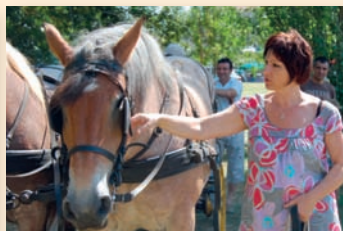
Festival âne et cheval de trait à Villognon