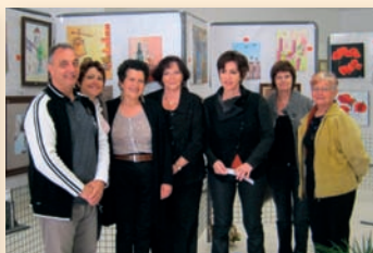
Exposition peinture - Club des Aînés d'Aunac