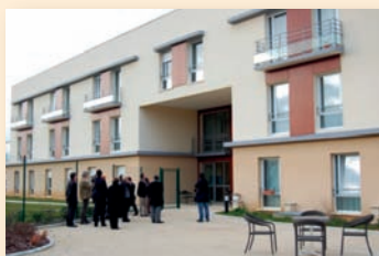
Inauguration Maison de retraite «Le Jardin d'Iroise» à Mansle