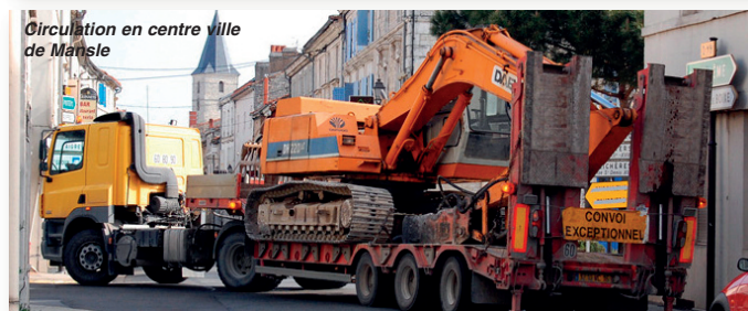
Circulation en centre ville de Mansle