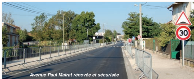
Avenue Paul Mairat rénoverée et sécurisée

Le Conseil général est bien sûr très attentif au déroulement de ces travaux. Pour ma part, je reste très mobilisée et très vigilante sur la bonne réalisation de ce projet routier (reclassement de la RD 739 et échangeur complet sur la RN 10) qui est une chance unique pour Mansle et notre territoire. Je suis à votre disposition si vous souhaitez plus d'informations. ■