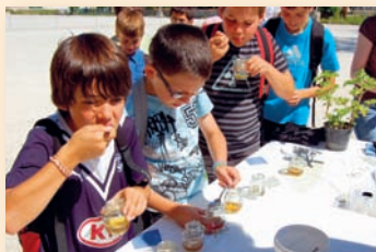
Manifestation «Croquez sport» à Mansle