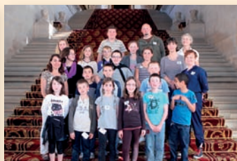
Visite au Sénat - Ecole de Valence